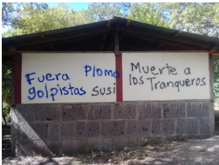
Grafitis amenazantes en una casa en Estelí, 31 de diciembre de 2019.

La resolución subraya la necesidad de garantizar las libertades políticas y civiles de todos los nicaragüenses, incluyendo la adopción de reformas electorales, el regreso de las personas exiliadas y el retorno de organizaciones internacionales, así como la cooperación con ellas 7 . Por último, el documento pide que se active la cláusula democrática del actual Acuerdo de Asociación entre la Unión Europea y Centroamérica, lo que iniciaría, efectivamente, el proceso de suspensión de Nicaragua del referido acuerdo 8 .