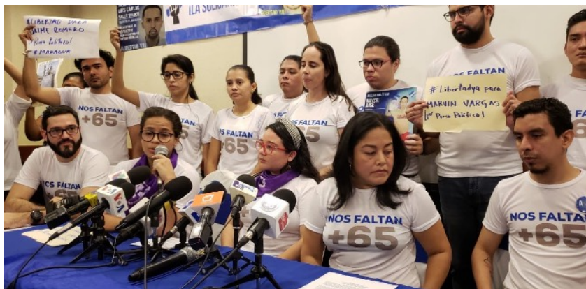
Foto: Artículo 66 Siete mujeres y nueve hombres detenidos el 14 de noviembre de 2019 por haber entregado agua a los huelguistas de hambre, después de su liberación. 8 de enero de 2020.

Un estudiante universitario de 19 años habría sido secuestrado el 17 de enero alrededor del mediodía por elementos progubernamentales encapuchados mientras se encontraba en una calle en Masaya. Presuntamente, antes de que sus captores los arrojaran de un coche en el municipio de Tisma -situado aproximadamente a 20 kilómetros de Masaya- el 19 de enero por la tarde, el estudiante habría estado cautivo en una habitación, atado de pies y manos. Mientras estuvo privado de libertad, el estudiante habría sido torturado, humillado y privado de comida y agua. Según la información recibida por la OACNUDH, antes de ser presuntamente secuestrado, el estudiante habría recibido varios mensajes amenazantes a través de las redes sociales y por teléfono.