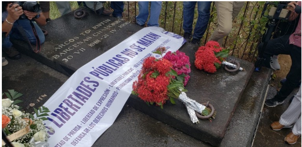
Foto: Artículo 66 Restricciones excesivas a los derechos civiles y políticos continúan registrándose en Nicaragua.

Introducción El presente boletín abarca el período comprendido entre el 1° de diciembre de 2019 y el 31 de enero de 2020, durante el cual la OACNUDH siguió registrando ataques perpetrados por agentes de policía o elementos progubernamentales contra personas que intentaron organizar protestas o que fueron percibidas como opositoras. También se observaron, reiteradamente, detenciones arbitrarias, hostigamientos, amenazas y actos de intimidación, incluso con ocasión de reuniones políticas organizadas por diferentes sectores de la oposición. El 30 de diciembre de 2019, el Gobierno otorgó medidas alternativas a la detención a 91 personas privadas de libertad en el contexto de las protestas. No obstante, las organizaciones de la sociedad civil advirtieron que al menos 65 personas siguen detenidas por las mismas razones. A finales de enero de 2020, cuatro hombres indígenas fueron víctimas de homicidio en una comunidad indígena Mayangna en el norte del país, suscitando gran preocupación.