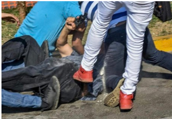
MANIFESTANTES NEUTRALIZANDO AL AGRESOR ARMADO FUERA DESCENTRO COMERCIAL METROCENTRO 30/03/2019

golpearon. Además tomaron presuntamente un documento de identidad que indicaba su afiliación al partido de gobierno.