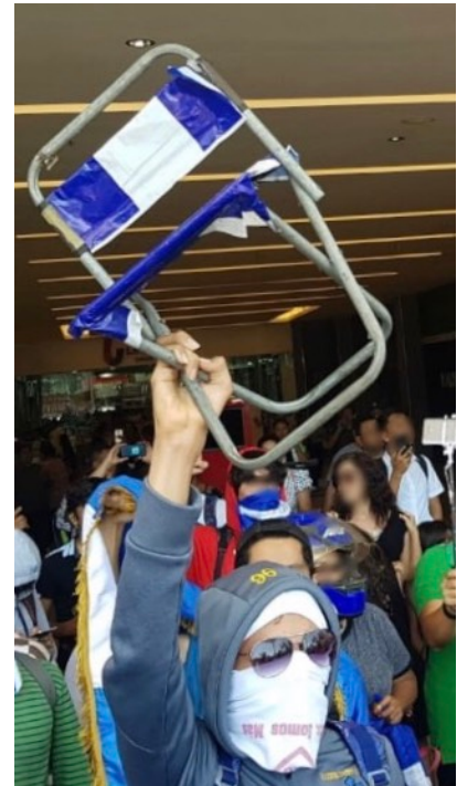
MANIFESTACIÓN EN MANAGUA. 30/03/2019

El 22 de marzo, la UNAB convocó a una manifestación a realizarse el 23 de marzo 21 . El 23 de marzo, la Policía Nacional señaló que "no permitirá ninguna actividad que altere el orden público, amenace o atente contra el derecho constitucional al trabajo, la libre movilización, la integridad física de las personas, familias y de los bienes públicos y privados" 22 . Durante las manifestaciones que tuvieron lugar en Managua y en otras partes del país, algunos manifestantes organizaron piquetes, hicieron sonar las bocinas de sus autos, lanzaron globos azules y blancos, cantaron el himno nacional y ondearon banderas nicaragüenses. No se reportaron incidentes mayores en esa fecha.